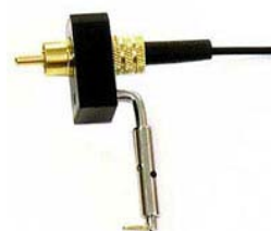
soporte de conector rígido para violín